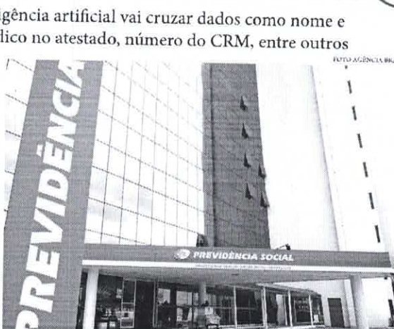
O requerimento é feito pelo aplicativo ou site Meu INSS

O Instituto Nacional do Seguro Social (INSS) inicia o uso de uma ferramenta de inteligência artificial criada pela Dataprev. A finalidade é realizar uma varredura nos atestados médicos que forem enviados pela internet para dar entrada em pedido por incapacidade temporária, o chamado auxílio-doença. A finalidade é identificar padrões e cobrir qualquer indicio de fraude ou golpe com o uso do Atestmed, programa que substitui o atendimento médico-legal por análise documental nos casos de benefício de até 180 dias. O requerimento é feito pelo aplicativo ou site Meu INSS e os segurados podem anexar o documento na plataforma. Segundo dados do governo federal, a análise de inteligência artificial vai cruzar dados como nome e assinatura do médico no atestado, número do Conselho Regional de Medicina (CRM), especialidade do médico, se o atestado apresentado é, de fato, de onde o médico trabalha, além de identificar o IP do computador, que é o endereço exclusivo de onde é enviado o arquivo. Atualmente, os atestados devem ser emitidos por médicos com inscrição no Conselho Regional de Medicina (CRM) e não podem ter nenhuma rasura. Além disso, precisam especificar o tempo de afastamento necessário